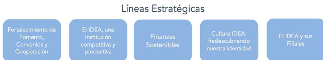
Gráfico 12 - Líneas estratégicas