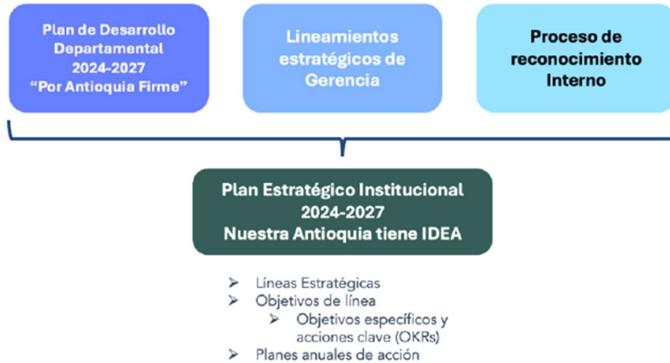
Gráfico 11 - Fuentes primarias de información del Plan Estratégico Institucional

El Plan Estratégico Institucional PEI para el periodo 2024-2027 se nutrió de tres fuentes primarias de información las cuáles marcaron la construcción de los objetivos estratégicos para el cuatrienio: